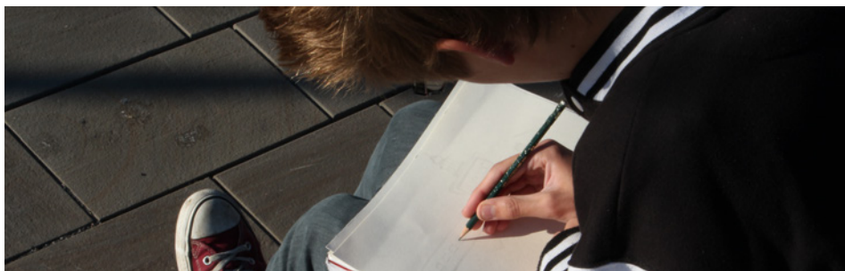
› Unterricht im Fach Gestaltungslehre/Zeichnen