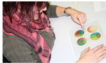
› Unterricht im Fach Gestaltungstechnik