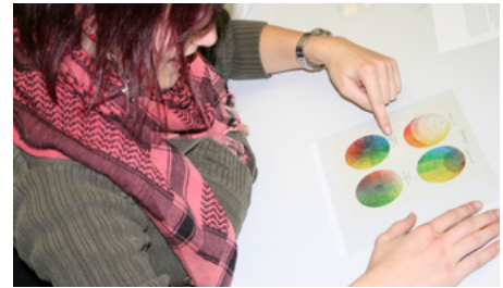
> Unterricht im Fach Gestaltungstechnik