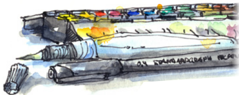
› Ergebnisbeispiel aus dem Projekt „Urban-Sketching“