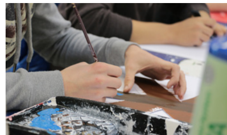
› Unterricht im Fachbereich Technik – Holz- und Farbtechnik

Der Unterricht erstreckt sich auf den berufsbezogenen Lernbereich, den berufsübergreifenden Lernbereich und einen Differenzierungsbereich. Im berufsbezogenen Lernbereich vermittelt die Schule viele Unterrichtsinhalte, die auch im ersten Jahr bei den Auszubildenden in der dualen Ausbildung unterrichtet werden. Zusätzlich werden hier noch Fächer wie Englisch und Mathematik unterrichtet. Der berufsübergreifende Lernbereich zielt vorrangig auf eine Erweiterung der Kenntnisse in den allgemeinbildenden Fächern ab. Die Unterrichtsinhalte weisen einen direkten Bezug zum berufsbezogenen Lernbereich auf.