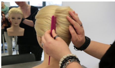
› Unterricht im Fachbereich Ernährungs- und Versorgungsmanagement – Körperpflege