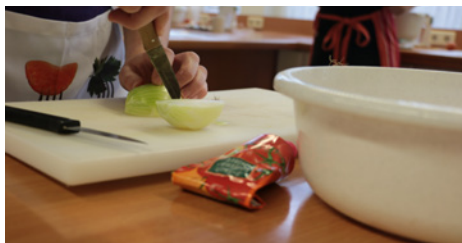
› Unterricht im Fachbereich Ernährungs- und Versorgungsmanagement – Hauswirtschaft

Für den Unterricht in der einjährigen Berufsfachschule sind weitere Anschaffungen (Arbeitsanzug, Küchenschürze, Zeichenausrüstung o. ä.) erforderlich. Diese Anschaffungen können jedoch bei Aufnahme einer Ausbildung im gleichen Berufsfeld weiterverwendet werden.