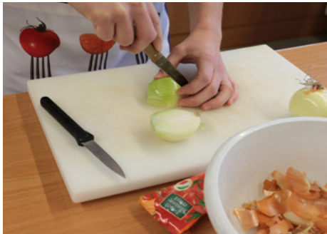
› Unterricht im Berufsfeld Hauswirtschaft