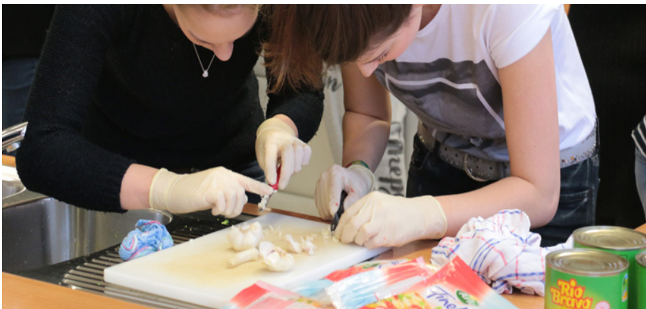
› Unterricht im Berufsfeld Hauswirtschaft