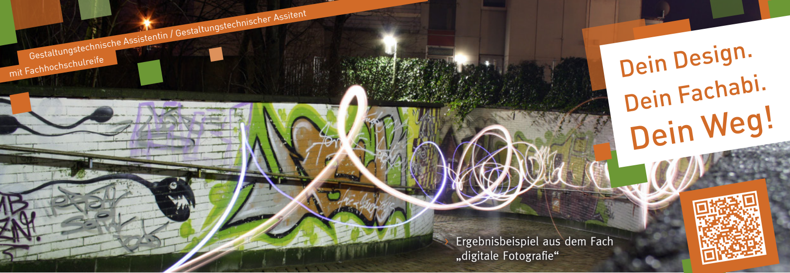
Ergebnisbeispiel aus dem Fach „digitale Fotografie“