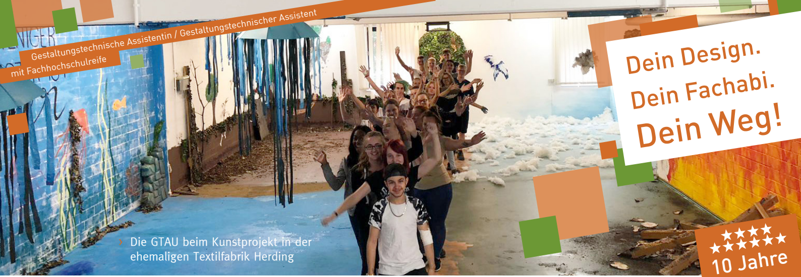
Die GTAU beim Kunstprojekt in der ehemaligen Textilfabrik Herding