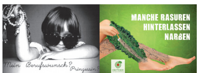
Wettbewerbssieger: Postkarten zum Thema „Berufswahl“ und „Regenwald“

Die Vielfalt der Aufgabenstellungen und Projekte geben den Schülerinnen und Schülern in den drei Ausbildungsjahren die Gelegenheit sich in dem weiten Feld der gestalterischen Berufe auszuprobieren und ihre Nische zu finden. In der schuleigenen Werbeagentur „Medienwerk“, an der die Schülerinnen und Schüler freiwillig nach Unterrichtsschluss teilnehmen, können sie ihre Kenntnisse erweitern, vertiefen und bei Kundenaufträgen ihre Ideen einbringen. So bekommen sie einen Einblick in die Agenturarbeit und identifizieren sich mit der Schule.