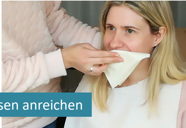
Übung: Essen anreichern