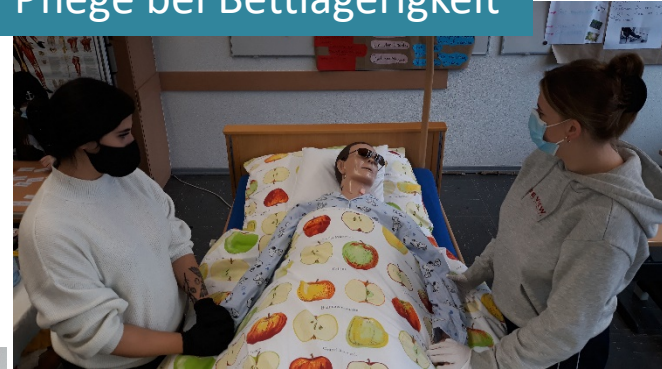
Pflege bei Bettlägerigkeit