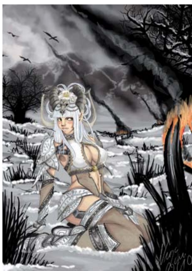
» Ergebnis eines Speedpaintingvideos von Nina Lorei Video Teil 1 http://www.youtube.com/watch?v=Cda2O9cPjNk Video Teil 2 http://www.youtube.com/watch?v=s_LrsN1zmDM&feature=mfu_in_order&list=UL