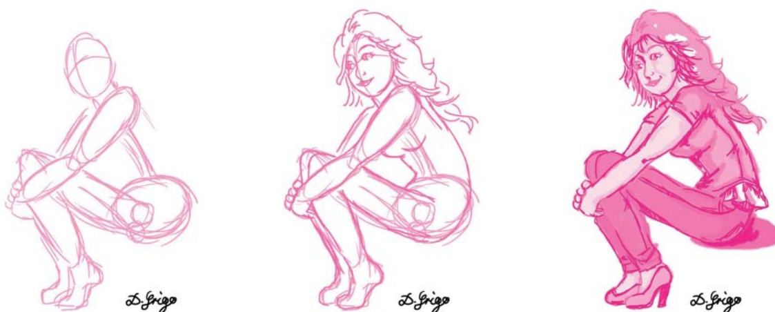
» Entwicklung einer Illustration für eine Bewerbungsmappe von Doreen Grigo